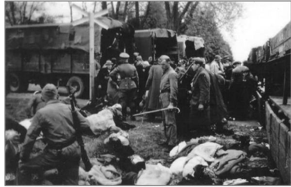
Ankunft in Chelmno 1942.

Inzwischen war das NS-Regime bereits auf dem Weg zur Vernichtung der europäischen Judenheit insgesamt. Der Herbst 1941 sah die ersten systematischen Massenvernichtungsdeportationen aus Deutschland in den Osten, eine Folge von Hitlers Entscheidung, alle Juden aus dem Reich zu entfernen. Auch wenn die meisten dieser Opfer noch nicht gleich bei der Ankunft ermordet wurden, war klar, dass sie nicht lange zu leben hatten. ... Währenddessen wurden Pläne für mehrere regionale Vergasungseinrichtungen auf besetztem polnischen und sowjetischem Gebiet gemacht, die auf osteuropäische Juden zielten, vor allem auf die als „arbeitsunfähig“ eingestuft. Chelmno (deutsch: Kulmhof) im Warthegau (westpolnisches Gebiet, das dem Großdeutschen Reich eingegliedert wurde) war das erste solche Todeslager, das am 8. Dezember 1941 seinen Betrieb aufnahm.