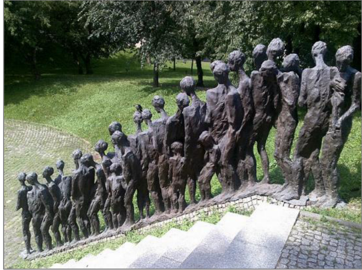
Minsk 2004, Denkmal und Skulpturengruppe.