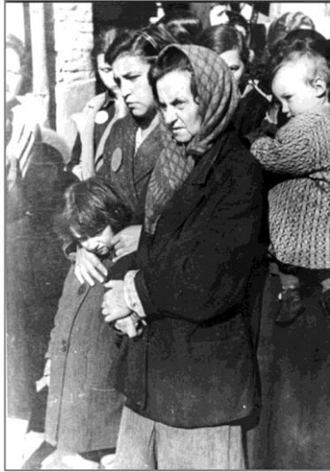
Minsk 1941, Jüdinnen im Getto.