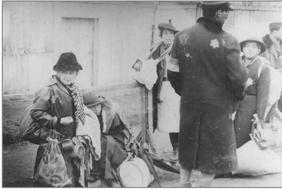
Deportation von Lodz nach Chelmno.