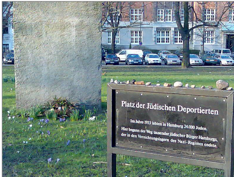
Gedenken in Hamburg.