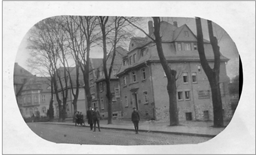
Bahnhofstraße Montabaur nach 1910.